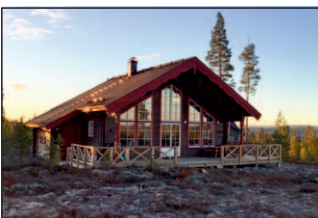
10b. Isabelle 78+loft Aquilavägen 8 Detta hus har inbyggd entré, förhöjt väggliv 20 cm och utdraget tak över gaveln.