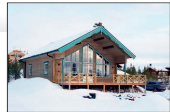
10a. Isabelle 78+loft Maskulla E25, Aquilavägen 6 Detta hus har inbyggd entré, förhöjt väggliv 20 cm och utdraget tak över gaveln.