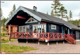
1. Sara 80+loft Toppheden A10, Lyrnåvägen 2 Rymlig och ljus fjällstuga. Ryggåstak med synliga limträbalkar.