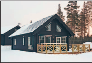
6a. Mia 58 + loft Vintergatan 2 Förlängd Emil 2,4 m med bastu och större glasparti