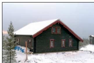
11. Isabelle 78+loft Taurusvägen 20 Detta hus är förlängt, har inbyggd entré och förhöjt väggliv 20 cm