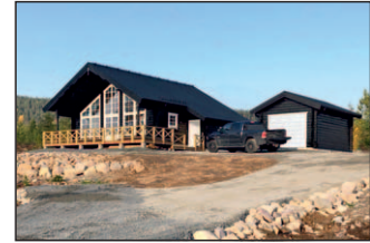
5b. Isabelle special Dracovägen 3. Huset är förlängt med inbyggd entré. Utrustat med garage.