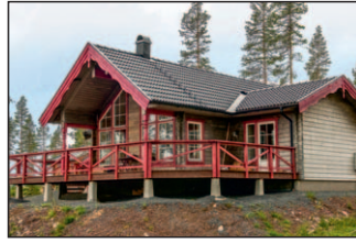
2. Anna-Lisa 80+loft Topp. A3, Topphedenbacken 16 Huset med en vacker symmetrisk fasad. Tre sovrum i bottenplan. Detta hus har förlängd storstuga.