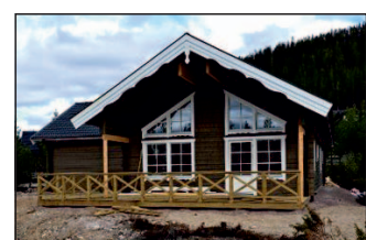
12. Emelie special+loft Taurusvägen 10 En Emelie med vinkelbyggnad.