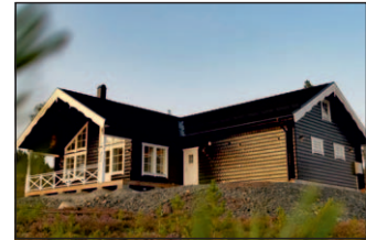
7. Emelie Special Deringbacken 7 Förlängt, förhöjt och med garage i vinkel.