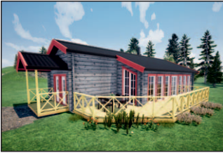
4. Annika Special Cygnusvägen 18 Under byggnation