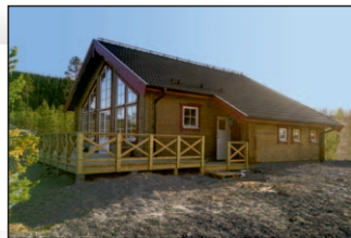
9. Isabelle Special Virgovägen 4 Rymligt loft över sovrumsdelen. Detta hus är förlängt 1,2 m och har inbyggd entré.