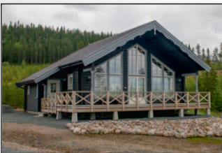
8. Isabelle 78+loft Maskulla E 25, Deringbacken 1A Detta hus har inbyggd entré, förhöjt väggliv 20 cm och utdraget tak över gaveln.