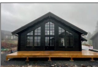
13. Isabelle Special Leovägen 4