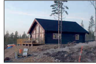
3. Isabelle special Lacerattavägen 4 Vår populäraste modell. Rymligt loft över sovrumsdelen. Detta hus är förlängt och har inbyggd entré.