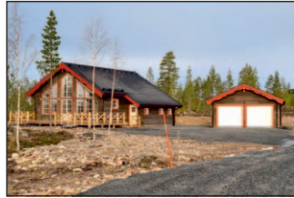
5a. Isabelle Special Dracovägen 10 Huset är förlängt med inbyggd entré.