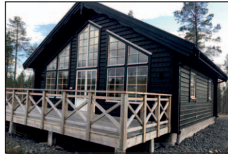
6b. Isabelle 78 + loft Vintergatan 2 Detta hus har inbyggd entré.